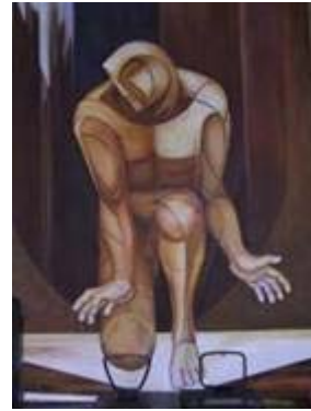
Guerrier de la Paix